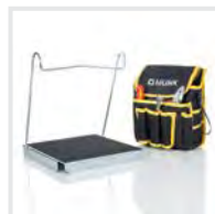
Sicherer Stand Bestell-Nr. 19324