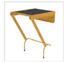
Einhängepodest R13 Bestell-Nr. 19900